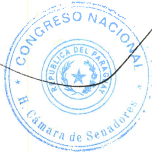
Silvio Ovelar B. Presidente H. Cámara de Senadores